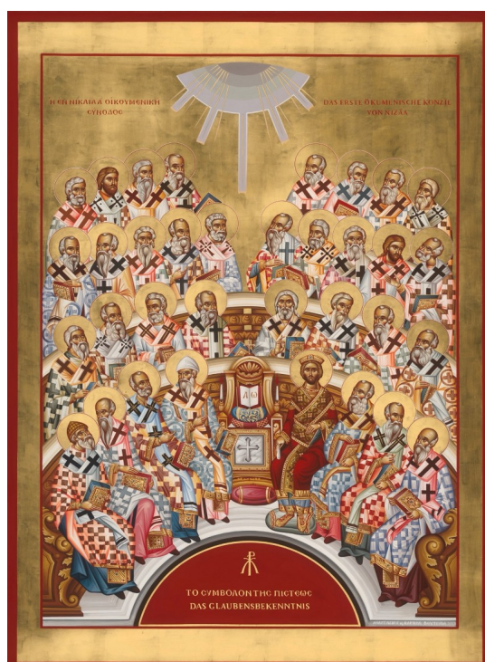
Nizäa-Ikone 2025, zeitgenössisch gemalt von Anastasios Voutsinas und Eleni Voutsina, Thessaloniki 2024 © Griechisch-Orthodoxe Kirchengemeinde Christi Himmelfahrt zu Berlin

Denn also hat Gott die Welt geliebt, dass er seinen eingeborenen Sohn gab, damit alle, die an ihn glauben nicht verloren werden, sondern das ewige Leben haben.